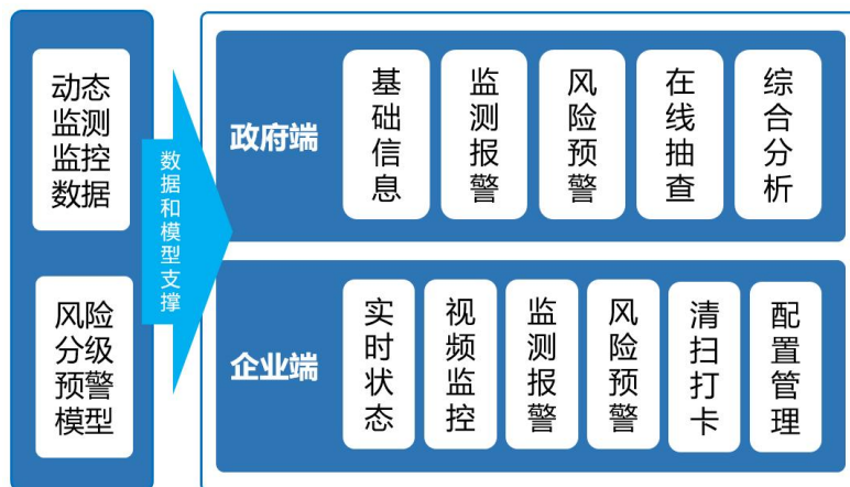
图 4 系统功能图